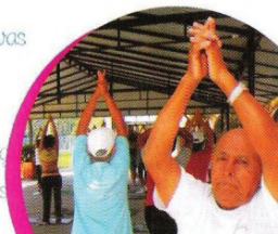
Figura 3 – Recorte 4 de material de divulgação do SOE.