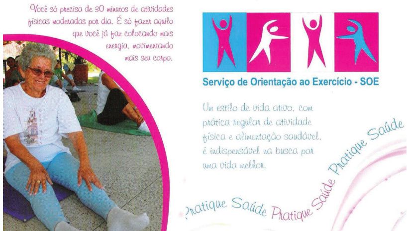
Figura 2 – Recortes 2 e 3 de material de divulgação do SOE.

A mesma visão que se manifesta nas falas dos usuários do SOE em relação à atividade física, bem como seu uso de modo a assemelhar-se, mutatis mutandis , ao uso de medicamentos, manifesta-se no discurso do próprio serviço.