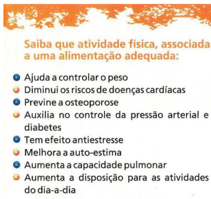
Figura 5 – Recorte 6 de material de divulgação do SOE.

Conforme argumenta Gomes (2009), os conselhos provenientes do universo acadêmico 6 e que dizem respeito à educação do indivíduo saudável, possuem pouca diversificação em seu conteúdo, na medida em que se embasam em argumentos “[...] cuja racionalidade é a mesma do discurso preventivo” (CZERESNIA, 2003, p. 47). Cabe destacar, ainda, que remetem a escolhas acertadas (do ponto de vista moral e racional), não se limitando à atividade física. Há agregação de outros componentes que envolvem, por exemplo, alimentação, higiene pessoal e, sobretudo, determinado modo de conduzir a própria existência.